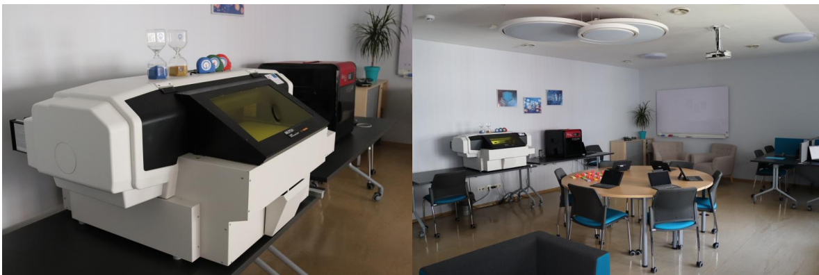
↑ Ekonomiski un sociāli aktīvo sieviešu atbalsta resursu centrs Jelgavā.

Projekta partneri izveidoja ekonomiski aktīvo sieviešu resursu centru tīklu Jelgavā, Daugavpilī, Pleskavā un Veļikije Lukos, kā arī regulāri rīkoja apmācības, seminārus un individuālās konsultācijas. Resursu centros ir pieejamas dažādas iekārtas radošu ideju īstenošanai. Piemēram, ekonomiski un sociāli aktīvo sieviešu atbalsta resursu centrā Jelgavā ir pieejama jaudīga multifunkcionālā iekārta, kas ļauj veikt 3D izdruku un skenēšanu, kā arī gravēšanu ar lāzeru, lai sievietes uzņēmējas radītu savu ideju pirmos prototipus vai reklāmas materiālus. Centru telpās ir iespējams rīkot tīklošanās pasākumus, kā arī izmantot tos kā kopbiroju, lai satiktos ar potenciālajiem klientiem un sadarbības partneriem.