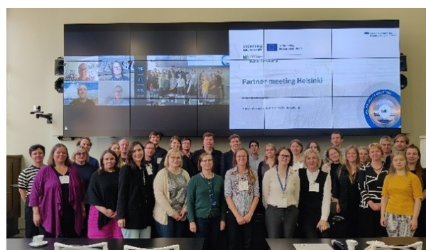
Attēls 2. Projekta partneru sanāksme Helsinkos.

Kopumā 13 partneru projekta sadarbība norisinās veiksmīgi, gan ikdienā, gan projekta sanāksmēs. Projekta atklāšanas sanāksme notika 2023. gada februārī Rīgā (skat. Attēls 1) un septembrī tika aizvadīta pirmā projekta partneru sanāksme Helsinkos (skat. Attēls 2). Regulāri tiek organizētas darba paku aktivitāšu tematiskās sanāksmes - intensīvs darbs norisinās pie Sea2Land Navigator palīgrīka komponentu (daudzlīmeņu pārvaldības instrumenta, jūras un piekrastes telpisko datu