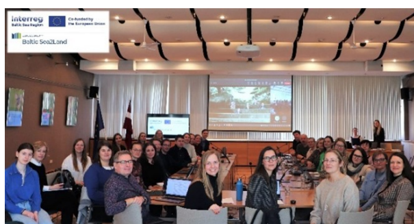
Attēls 1. BalticSea2Land Atklāšanas sanāksme Rīgā.

piekraste ir vienota, daudzpusīga sistēma ar katrai vietai piemītošām īpatnībām. Tā kā jūras piekrastes pārvaldībā ieinteresēto pušu īpatsvaru veido plašs spektrs dažādu līmeņu institūciju, plānošanas process ir sarežģīts un laikietilpīgs, tādēļ panākt saskaņošanu visā sauszemē un jūrā ir izaicinājums. Lai sasniegtu mērķus, ir jāizmanto tāda plānošanas pieeja, kas saglabā līdzsvaru starp visām mērķa grupām un ieinteresētajām pusēm, izmantojot kā cilvēka, tā dabas kapitālu.